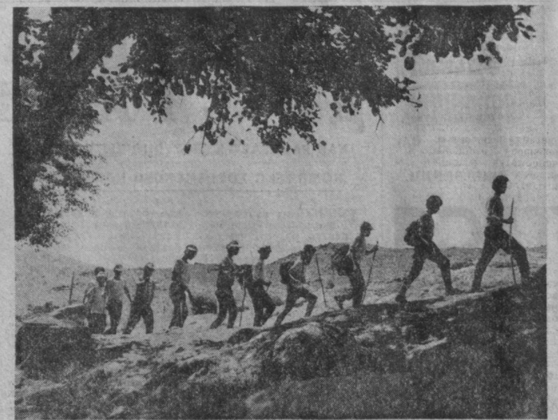
В живописном урочище Агалык расположен пионерский лагерь санаторного типа, где отдыхают и восстанавливают здоровье дети рабочих и служащих самаркандского завода «Красный двигатель» имени В. И. Ленина. Здесь созданы все условия для этого. Ребята совершают увлекательные походы по горам, изучают родной край, собирают растения для гербария. В лагере работают спортивные секции и кружки. Только в нынешнем месяце заводской пионерский лагерь принял на отдых и лечение 500 детей.

Верность прогрессивного кинематографа принципам гуманизма, мира и дружбы между народами продемонстрировал XII Московский международный кинофестиваль, завершившийся 21 июля в столице. Фестивальный экран убедительно подтвердил высказанную в приветствии Леониды Ильича Брежнева участникам и гостям Московского Форума мысль о высокой миссии, которую выполняет в современном мире кинематограф. Его важная роль в отстаивании идеалов добра, справедливости, свободы, мира, укрепления взаимопонимания между народами, развития их духовного общения. Торжественное закрытие грандиозного праздника кино, в котором приняли участие представители кинематографов пяти континентов, состоялось в Центральном фестивальном зале в гостинице «Россия».