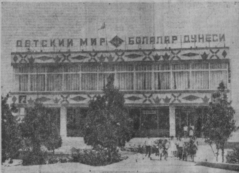
Магазин «Детский мир», открытый недавно в поселке Бишент Кашкардэринской области.