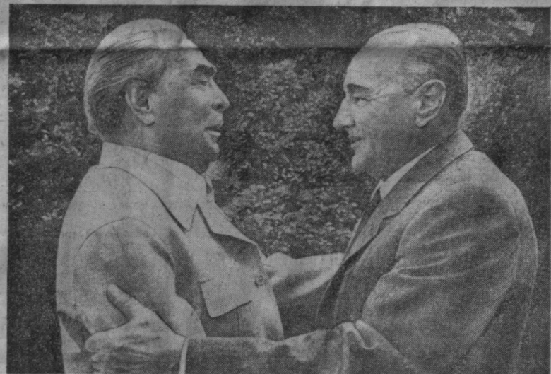
Во время встречи.