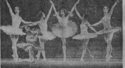
СЕГОДНЯ В МОСКВЕ ЗАКОНЧИВАЕТ СВОИ ВЫСТУПЛЕНИЯ ГОСУДАРСТВЕННЫЙ АКАДЕМИЧЕСКИЙ БОЛЬШОЙ ТЕАТР ОПЕРЫ И БАЛЕТА ИМЕНИ АЛИШЕРА НАВОИ.

Особенно хочется сказать об оркестре — замечательном, высокопрофессиональном коллективе. Сильная струнная группа, хороший ансамбль. И это заслуга, ко-