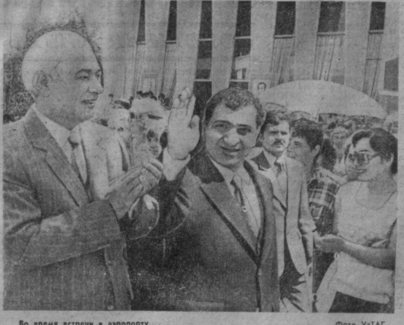
Во время встречи в аэропорту.

В честь высокого гостя был дан обед от имени ЦК Компартии Узбекистана, Президиума Верховного Совета и правительства республики. В тот же день Вабран Кармаль отбыл на родину. (УзТАГ).