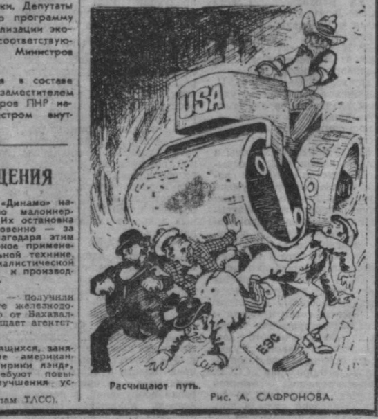
Расширяют путь. Рис. А. САФРОНОВА.