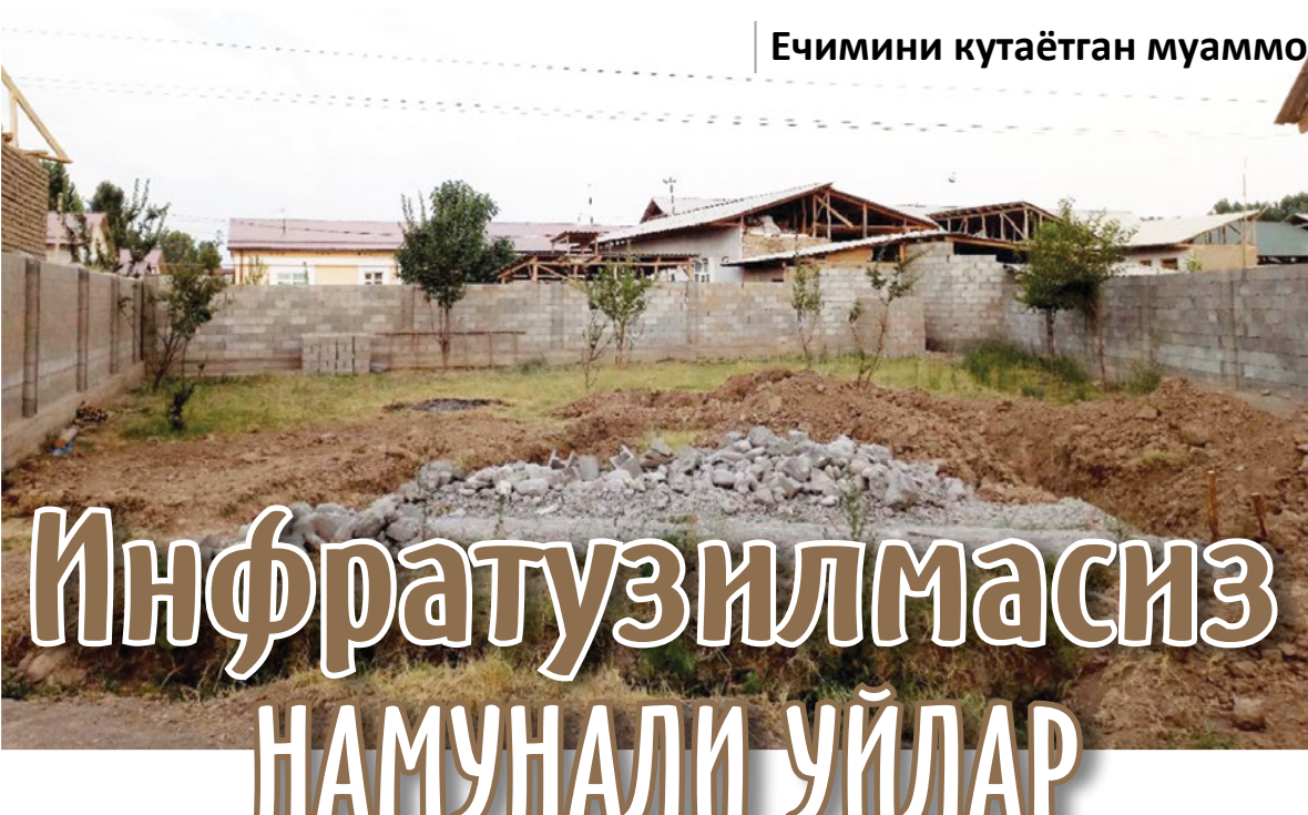
Ечимини кутаётган муаммо

Избоскан туманидаги «Даминбойчек» ва «Оқ олтин» маҳаллалари ўртасида намунавий лойиҳа асосида 110 та ўй қурилган. «Оқ олтин» маҳалласи ҳудудидаги ушбу хонадонларда асосан ёш оилалар яшайди. Аммо бу ерда стадион, болалар майдончаси, гузарча ва шунга ўхшаш инфратузилма объектлари йўқ.