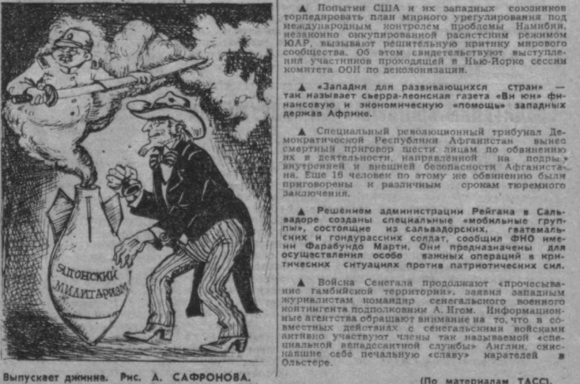
Выпускает динина. Рис. А. САФРОНОВА. (По материалам ТАСС.)

Соединенные Штаты активно поддерживают милитаристские круги Японии в их усилиях по наращиванию военного потенциала страны. По плану пентагонских стратегов вооруженные силы Японии должны будут по территории США размещаться за пределами японской территории для замены американских войск в случае чрезвычайных обстоятельств. (Из газет.)