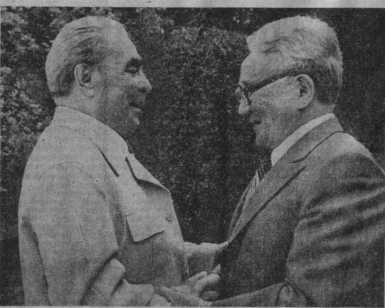
Во время встречи.

Таков подход Советского Союза и Монголии, в частности, к отношениям с Япо-