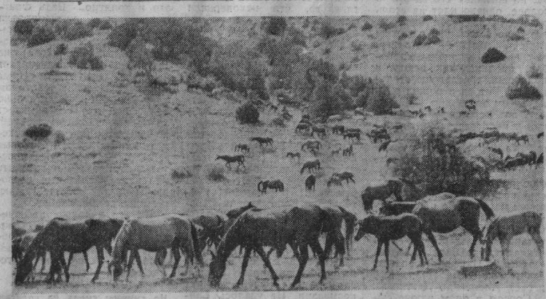
Димаганский конезавод имени С. М. Буденного — одно из двух хозяйств этого типа в Узбекистане, где выращивают лошадей знаменитой карабайрской породы. Селекционная и племенная работа ведется здесь уже шестидесять лет. На снимке: табуны карабайров на отгонных пастбищах в Бахмалском урочище.

Сразу же после победы февральской революции Колесов вступил в Ташкентскую объединенную организацию РСДРП и примкнул к группе большевиков, стал одним из активных участников рабочего движения в Туркестане. В марте 1917 года его избрали председа-