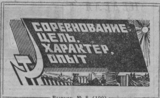
Выпуск № 8 (100)