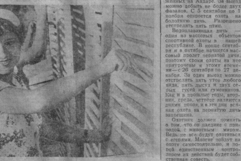
Адрес редакции: 200000, Ташкент-П, ул. Ленина, 41...