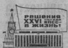
Решения XXVI партсъезда в жизнь!

За счет усиленного ухода за виноградниками поздних сортов здесь решили дополнительно к плану собрать каждой бригадой еще по 40 тонн продукции. Сурхандарьинская область.