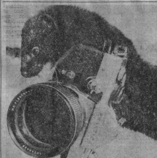
Широким спросом у жителей нашей республики пользуется мех норки. Удовлетворить его в значительной степени сможет Галиярское специализированное хозяйство, где уже сейчас насчитывается около 6 тысяч лисьих зверюшек северо-голубой и различной гаммы коричневых расцветок. В нынешней пятилетке поголовье норки планируется увеличить в десять раз. На снимке: любительское фотоаппаратом Темно-коричневая норка с интересом «изучает» фотоаппарат.

13.40 «Дарить людям воду» (рус.). 14.10 Телевизионный театр. П. Мериме, «Исчо и ад». 15.05 «Безопасность дорожного движения» (рус.). 18.15 Программа «Мир детей». 18.20 Для детей. «Угадайка» (рус.). 18.50 «Человек и закон». 19.30 «Ахборот» (узб.). 19.45 «Ирри, ирри, ирри». 20.30 «Ахборот». 20.45 «Кундуз» айтан стар муротла». Конкурсная программа (повторение). 21.30 Месина. «Время». 22.05 Вешние. ХХV съезда КПСС — в кино!. 22.25 «Шит и меч». Художественный фильм. 4-я серия. «Последний рубель». 23.35 Программа ПРОГРАММА ТАДЖИКСКОГО ТЕЛЕВИДЕНИЯ