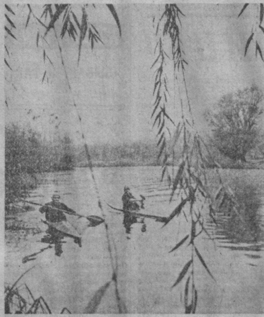
Байдорочкин на Анкоре.