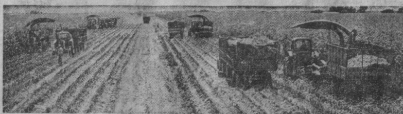
ФОТОРЕПОРТАЖ С КУКУРУЗНОГО ПОЛЯ

Высокие среднесуточные привесы бычков добились бригады Хантабасой из совхоза промкомплеса имени XXV съезда КПСС целинного Илчического района. Каждое животное здесь ежедневно прибавляет в весе 1.000 граммов. Труженики хозяйства, где содержится 12 тысяч голов крупного рогатого скота, намерены в этом году сдать государству 2.200 тонн мяса — на 160 тонн больше плана. (УзТАГ).