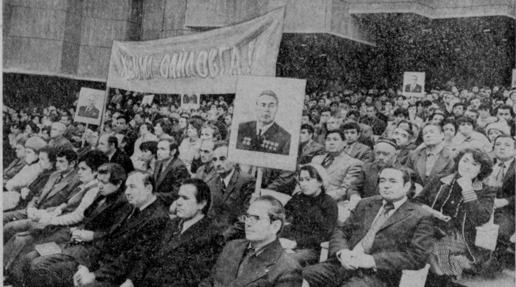
На снимке: в зале Дворца искусства во время встречи.

пидаты названы также руководители и специалисты различных отраслей народного хозяйства, партийные и советские работники. 17 из них являются Героями Советского Союза и Социалистического Труда. 5 — лауреатами Ленинской и Государственной премий. Почти пять лет отделяют нас от прошлых выборов. За этот период мы достигли новых социальных и духовных вершин, уверенно продвинулись вперед на всех участках хозяйственного и культурного строительства. Прошедшие со времени последних выборов годы были богаты многими замечательными событиями, придавшими всей жизни нашей страны особую приподнятость. В 1976 году состоялся исторический XXV съезд