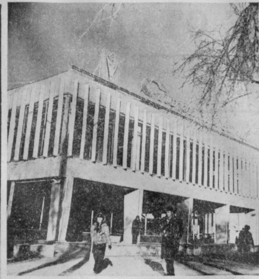
ПО ГОРОДАМ УЗБЕКИСТАНА, ИСКУС. МАГАЗИН СПОРТИВНЫХ ТОВАРОВ В ЦЕНТРЕ СТОЛИЦЫ АВТОНОМНОЙ РЕСПУБЛИКИ.

В поездку по Нечерноземью отправился фольклорно-инструментальный ансамбль «Гулистан». Самодеятельные артисты выступят с концертами перед труженниками новых совхозов Исковской и Новгородской областей, в строительстве которых принимают участие посланцы солнечного Узбекистана, в том числе и голландцы. К этой поездке коллектив, удостоенный высокого звания народного, подготовил специальную программу. (УзТАГ).