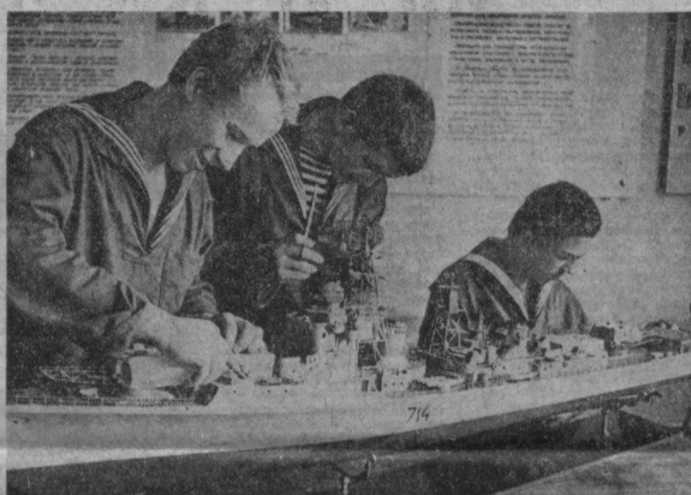
ЗА ТЫСЯЧИ КИЛОМЕТРОВ ОТ МОРЯ

«Отличная учеба в школе — классный специалист на флоте» — такъв девиз курсантов Ташкентской морской школы ДОСААФ, на тысячи километров удаленной от настоящих морских просторов. За семнадцать лет ее работы первый шаг в большую плавнину сделали здесь тысячи ташкентских ребят. В школе созданы все условия для подготовки будущих моряков. Там в это году состоялось очередное совместное заседание коллегии Министерства строительства и эксплуатации автомобильных дорог республики и Министерства внутренних дел Узбекской ССР, на котором были подведены итоги рабо-