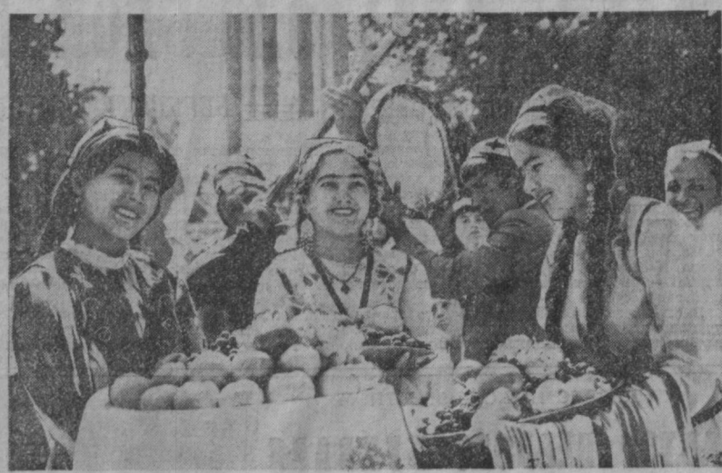
Традиционная осенняя выставка «Щедрость земли самаркандской» открылась в Самаркандском центральном парке культуры и отдыха имени М. Горького. В ней участвуют около 300 колхозов и совхозов, промышленных предприятий и научно-исследовательских институтов, опытных станций и т. д. На выставке представлено 80 видов сельскохозяйственной продукции. Здесь демонстрируются достижения ученых и работников сельского хозяйства, новинки промышленных предприятий. Большой раздел выставки отведен животноводству и птицеводству, где представлены лучшие экземпляры крупного рогатого скота, лошадей, овец, коз, кур. В торговых точках идет продажа овощей и фруктов — в дни работы выставки здесь и в специализированных магазинах города население будет реализовано 17 тысяч тонн овощей, фруктов и бахчевых, что на 600 тонн больше, чем в прошлом году. На снимке — время открытия выставки «Щедрость земли самаркандской».

В результате принятых мер урочища на каждом квадратном метре закрытого грунта в текущем году составило 14,5 килограмма, что на 3 килограмма больше установленного задания.