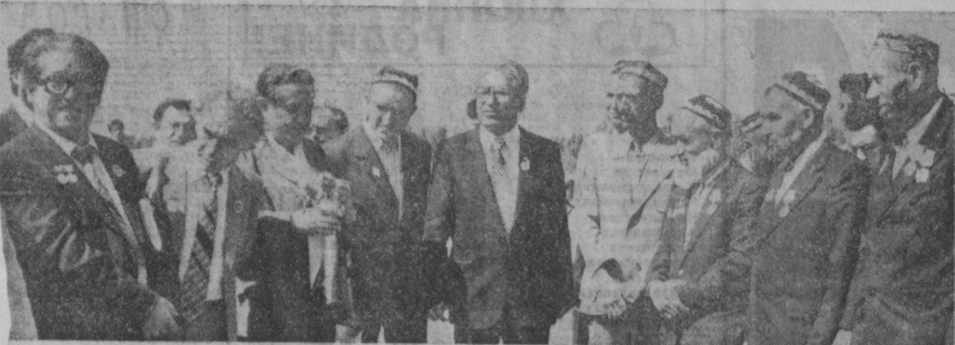
Частини дней литературы и искусства Узбекистана в Таджикской ССР беседуют с картофелеводами совхоза имени Хамма Райзабадского района.