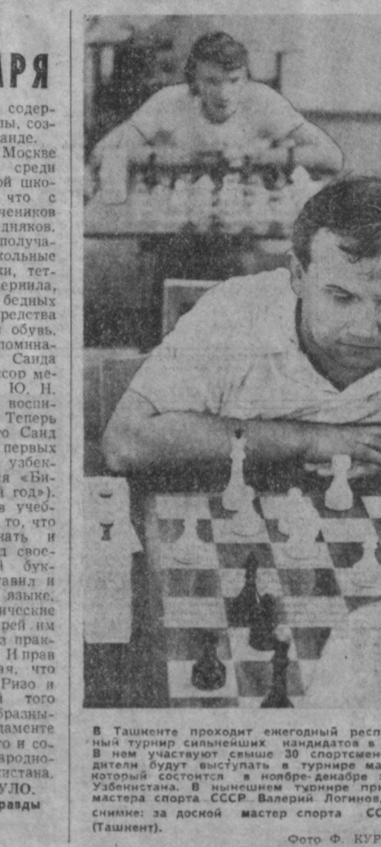
В Ташкенте проходит ежегодный республиканский шахматный турнир...