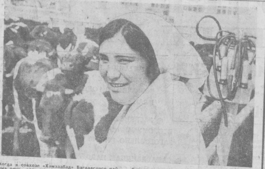
Когда в совхозе «Хамзабад» Багдадского района речь заходит о передовых животноводках, вы видите на этом снимке. Делегат XX съезда Компартии Узбекистана, депутат областного Совета, она работает так, чтобы сдержать слово — находит за год от каждой закрепленной коровы 4.500 килограммов молока.