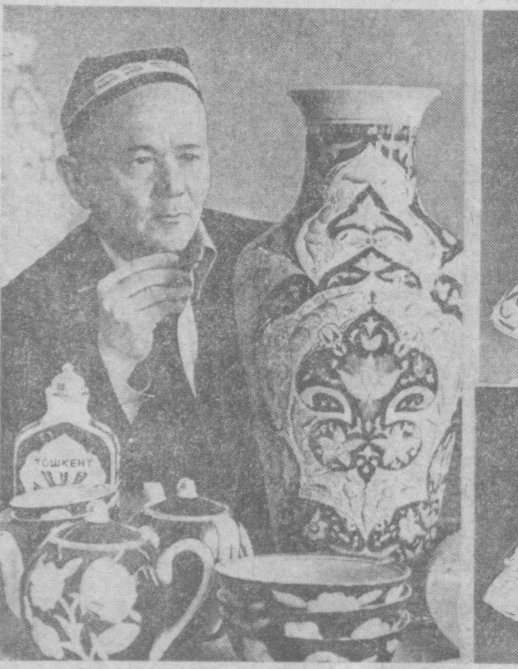
Группа художников Ташкентского фарфорового завода при студии и подборку эскизов и изготовленные сувенирные изделия, посвященные 2000-летию Ташкента. На снимках: на-