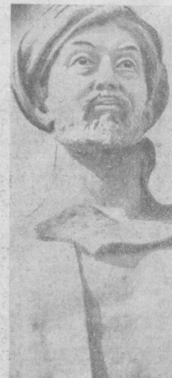
Современная действительность и история родного народа, воплощенные в образе Человека, — этому посвящено творчество скульптора Хусниддинходжаева.

В Ташкенте — переменная облачность, без осадков. Ветер северо-западный, 9-14 м/с. Температура 16-18 градусов.