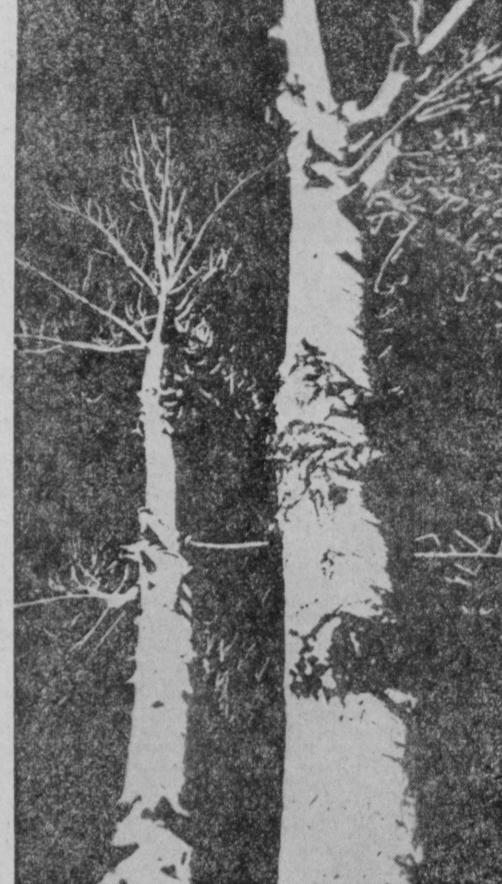
НОЧНАЯ ТИШИНА.