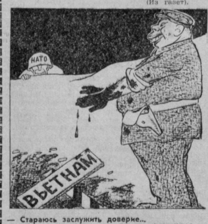
Староус заслужит доверие... Рис. Н. ЛЕУШИНА.

И тем не менее США не оставили своих попыток. На этой неделе в Кэмп-Дэвиде начался новый раунд сепаратных египетско-израильских переговоров.