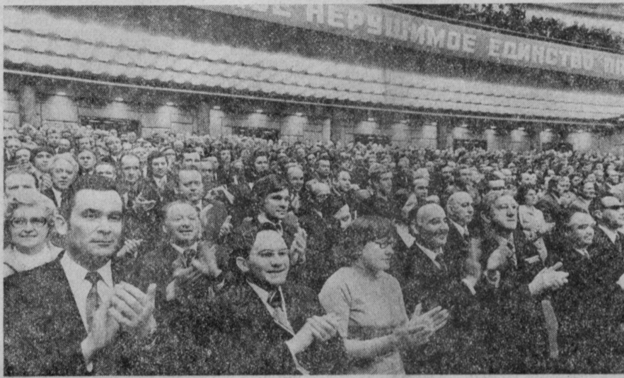
Кремлевский Дворец съездов. Встреча избирателей Бауманского избирательного округа столицы с кандидатом в депутаты Верховного Совета СССР товарищем Л. И. Брежневым.