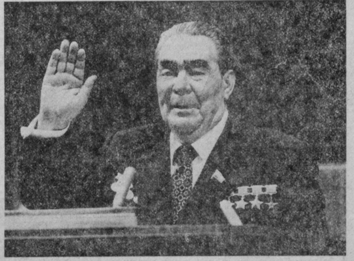
Леонид Ильич Брежнев последовательно, с величайшей энергией и дальновидностью Центрального Комитета КПСС и Советского государства по обеспечению мир-

Понятно, весь советский народ назвал своим кандидатом в депутаты Верховного Совета СССР Л. И. Брежнева. В этом — высокая оценка огромных заслуг товарища Брежнева перед партией и народом, его неумолимой деятельности во имя коммунизма и мира, дальнейшего всестороннего расцвета нашей страны.