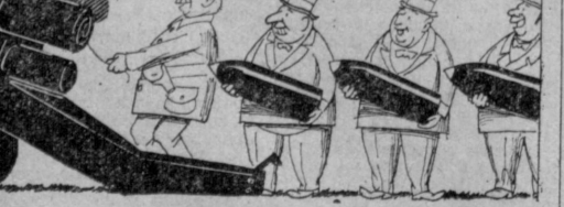
Современный оружейный расчет в армии пекинских гегемонистов. Рис. Н. ЛЕУШИНА.

Воспользовавшись нападением пекинских милитаристов на Вьетнам, империалистические монополии торпедятся получить заказы на вооружение китайской армии. (Из газет).