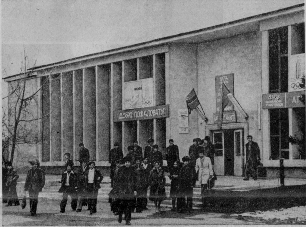
Сегодня гостеприимно распахнули свои двери 5246 избирательных участков, созданных в городах, поселках, кишлаках и аулах Узбекистана. Это на 306 участков больше, чем их было в предыдущие выборы. Почти на 700 тысяч человек за это время возросло количество избирателей. Торжественно, нарядно выглядят помещения, где проводятся вы-

«Разрядка остается важнейшей задачей советской внешней политики», — констатирует французская «Фи»