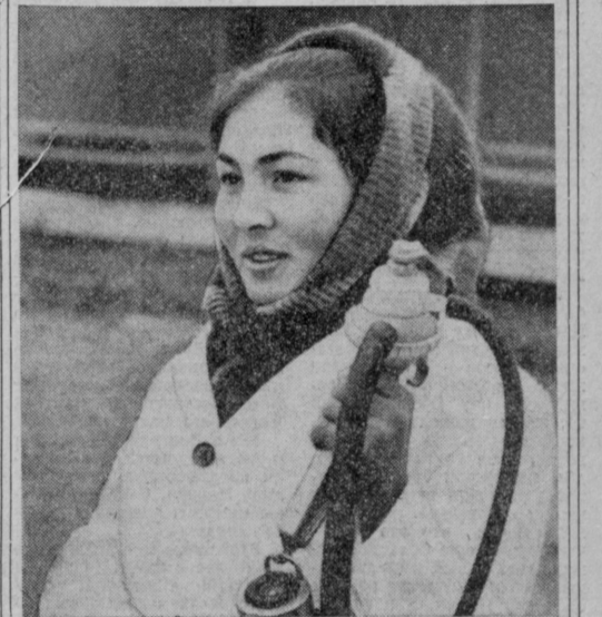
Животноводы колхоза имени XIX партсъезда Шаватского района решили продать государству 350 тонн молока...