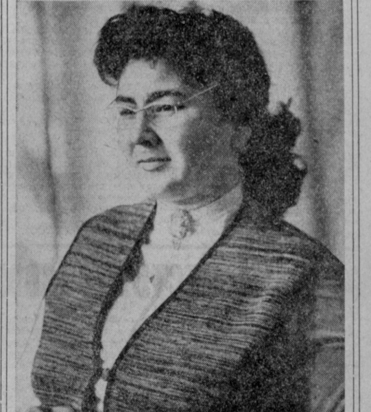
Заслуженной известностью не только в республике, но и во всей стране и за рубежом пользуется главный дирижер Государственного академического Большого театра оперы и балета Узбекской ССР имени А. Навои...