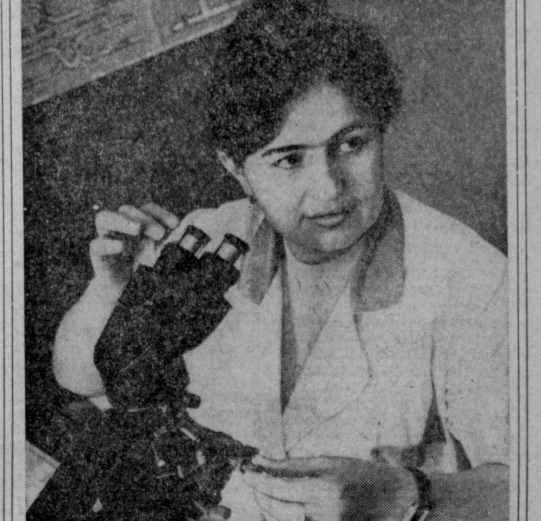
Ученые Института экспериментальной биологии растений Академии наук Узбекской ССР занимаются выведением новых эффективных сортов хлопчатника...