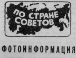
ПО СТРАНЕ СОВЕТОВ

№ 59 (18938) Воскресенье, 11 марта 1979 года Цена 2 коп.