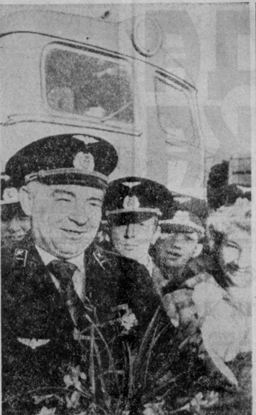
Бригадный подряд — важный рычаг повышения эффективности автотранспорта