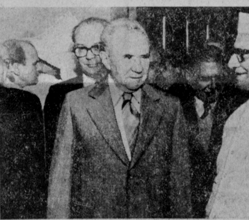
Дели. Во время встречи Председателя Совета Министров СССР А. Н. Косыгина с Премьер-министром Республики Индия М. Десаи.

ДЕЛИ. 10 марта (Спец. корр. ТАСС). Продолжается официальный дружественный визит в Индию Председателя Совета Министров СССР А. Н. Косыгина.