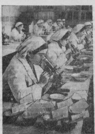
Коллектив Самаркандского гравовода единодушно выразил в социалистическом соревновании за отличную подготовку и веселым выкором турного шенопрада. Сейчас на заводе идет государственная контрольная проверка грены к веселому ее оживлению и раздате шеноводческим колхозам для весенних выкором гусениц. На снимке: микроскопическое определение качества грены.