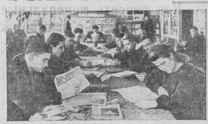
Ежедневно читальный зал библиотеки завода «Ташсельмаш» посещают многие рабочие, инженеры, техники, служащие. На снимке: в читальном зале библиотеки.