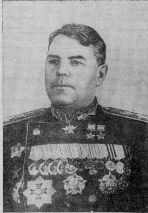
Военный Министр Союза ССР Маршал Советского Союза А. М. Василевский.