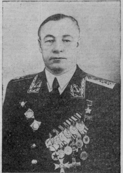
Военно-Морской Министр Союза ССР Вице-адмирал Н. Г. Кузнецов.