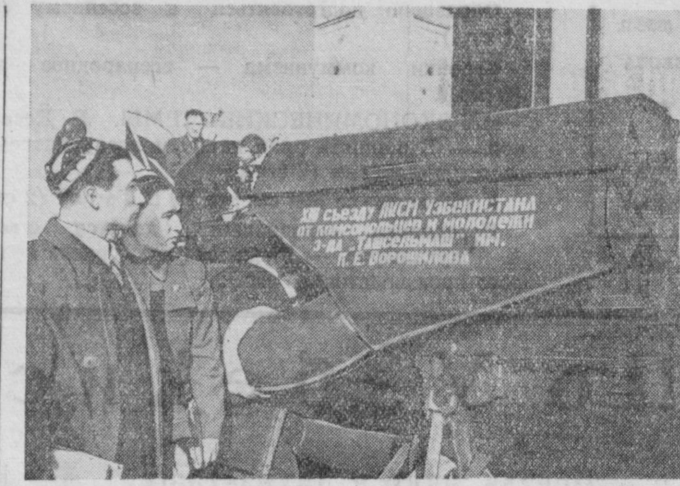
Комсомольцы и молодежь завода «Ташсельмаш» им. Ворошилова изготовили во внеурочное время 19 сельскохозяйственных машин в подарок XIII съезду ЛКСМ Узбекистана. Две из них — хлопкоочесная и универсальный хлопкоочесатель — были продемонстрированы делегатам съезда. На снимке делегаты съезда осматривают универсальный хлопкоочесатель.

Поступающие от топографов и буровиков материалы обогащаются проектировщиками. Группа проектировщиков совместно с научными сотрудниками Крымского филиала Академии наук СССР приступила к составлению почвенной карты всей зоны орошения.