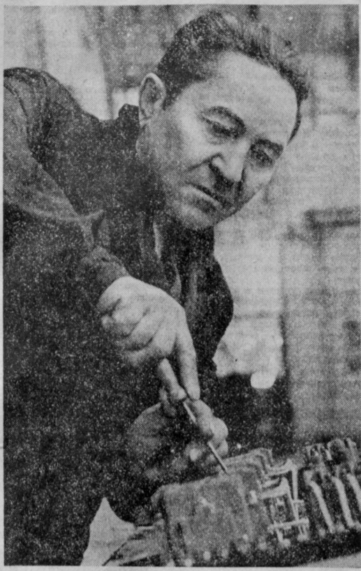
Ежедневно до полторы нормы выполняет передовой слесарь-сборщик андижанского завода «Электроррапарат»...

Президиум Верховного Совета Узбекской ССР за долготелюлетнюю плодотворную работу в области сельскохозяйственного строительства и в связи с семидесятилетием со дня рождения уважаемой Почетной грамотой Президиума Верховного Совета Узбекской ССР Ибрагимовича — председателя севчанского отделения ВАСХНИЛ.