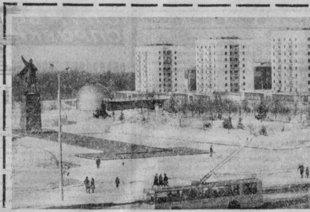
БАШКИРСКОЙ АССР-60 ЛЕТ

МЫ ДАЛИ ВОЗМОЖНОСТЬ, НАПРИМЕР, БАШКИРСКИМ МАССАМ УЧРЕДИТЬ АВТОНОМНУЮ РЕСПУБЛИКУ ВНУТРИ РОССИИ, МЫ ВСЯЧЕСКИ ПОМОГАЕМ САМОСТОЯТЕЛЬНОМУ СВОБОДНОМУ РАЗВИТИЮ КАЖДОГО НАРОДА... В. И. ЛЕНИН