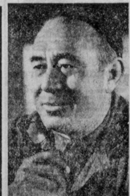
На снимке — один из старших рабочих механических мастерских теплового цеха Ташкентского машиностроительного завода имени Хамзы Шарасулова. Он владеет несколькими металлообрабатывающими профессиями, и в свой трудовой календарь записал 1982 год. Уданный коммунистическим трудом Х. Шарасулов за трудовую доблесть удостоен нескольких правительственных наград.

Из этого следует, что надо изыскивать возможности для ускорения темпов развития системы профтехобразования. А такие возможности имеются. За последние три года профтехобразование лучше всего развивается в Андижанской, Хорезмской, Ташкентской, Самаркандской областях. В каждой из них создано от 11 до 35 новых училищ. В то же время в Джизакской, Ферганской, Кашгарской и Сырдарьинской областях организовано только по 2-4 училища. В результате по охвату населения профтехобразованием. Самый высокий показатель в Самаркандской области, где на 10 тысяч человек приходится 169 училищ ПТУ; в Бухарской области — 134 училища. А вот в Сырдарьинской, Джизакской и