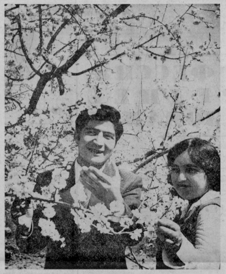
ВЕСНА В ДОЛИНЕ СУРХАНА. В школьном саду колхоза имени М. Горького Термесского района.

ДАТ (Соб. корр.). Здесь в Райцентре поселка Коммунальное «Узбекирволл» в эксплуатацию введена новая автоматическая телефонная станция на 500 номеров.