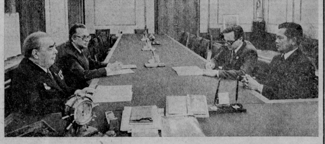
Во время беседы.

Советский Союз, отметил Л. И. Брежнев, исходит из того, что сейчас создаются возможности для развития устойчивых, основывающихся на дружбе, взаимном доверии и добрососедстве отношений между всеми странами Индокитая. Он полностью поддерживает социалистический Вьетнам, который хочет жить в мире с Таиландом и со всеми государствами, своими соседями — странами Юго-Восточной Азии. На беседе присутствовал референт Генерального секретаря ЦК КПСС Е. М. Самойлович. (ТАСС).