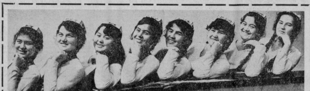
Уже десять лет радуется своим землякам самодельный ансамбль «Дустилик тароналари» (Мелодия дружбы) из Узбекистана...