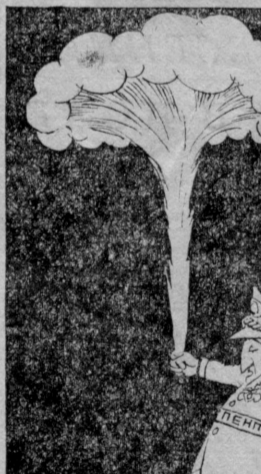
Вашингтонский канатоходец и его любимый зонт.