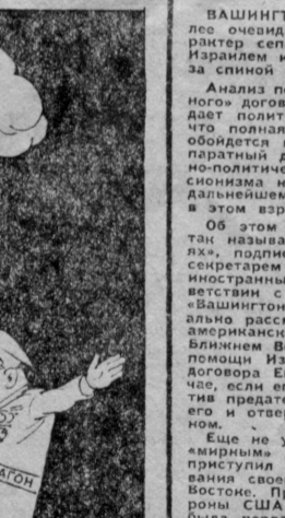
Рис. Н. ЛЕУШИНА.