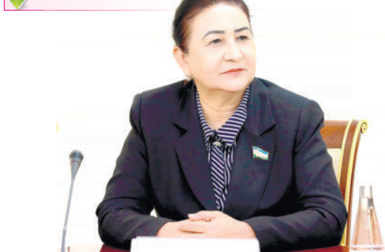
Музафара АБДИЕВА, Олий Мажлис Қонунчилик палатасидаги "Адолат" СДП фракцияси аъзоси