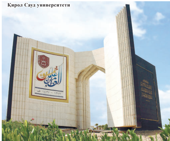
Қирол Сауд университети

мангоний" деб ўзларини таништиришлари бежиз эмас. Кўп ҳолларда эса ватандошларимиз Урта Осиёдан эканликларини билдириш мақсадида "Туркистоний", "ал-Бухорий" номларини ўз исм-шарифларидан кейин қўшиб қўйишади. Ислам дунёсида Имом ал-Бухорийнинг мавқеи ва обрўлари шу қадар баландки, юртдошларимиз Ўзбекистондаги қайси жойдан келиб чикмасин, уларни "бухорийлар" деб аташади. Саудия Арабистонинида ҳам "бухорийлар" кўпчилигини ташкил этади. Аввало, ҳозирда Саудия Арабистонинидаги ўзбеклар сони ҳақида бироз мулоҳаза билдириб ўтсак. Биз учратган китоб ва мақолаларда улар ҳақида турлича маълумот берилади.