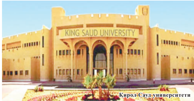
Қирол Сауд университети