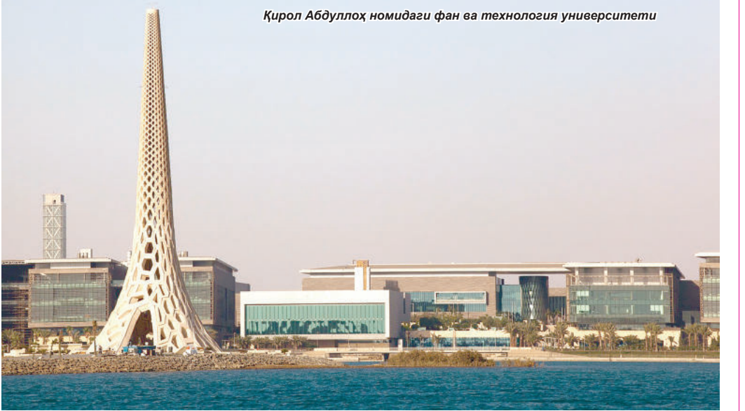
Қирол Абдуллоҳ номдаги фан ва технология университети

"Янги Ўзбекистонда янги Ренессанс истиқболлари" мавзусида саудиялик мутахассислар билан халқаро симпозиумлар ташкил этиш, мамлакатлар қўлэма фондлари ўртасида маълумот алмашишуви, хусусан, юртдошларимиз томонидан XX асрнинг бошларида Арабистон диёрларига олиб чиқиб кетилган қўлэма манбаларининг ҳамкорликда тадқиқи йўлга қўйилса, мақсадга мувофиқ бўлади. Ўзбекистон илмфан ва маданият кунларини Саудия Арабистонинида ўтказиш, илмий соҳада