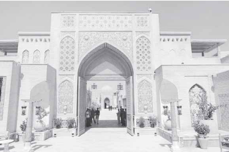
Уйғунлашган шоу маросимга ўзгача шукӯҳ бағишлагани ҳам алоҳида қайд этилган.

"Янгидан қурилиб, бугун очилаётган "Буюк Ипак йўли" маркази шу йўлдаги яна бир улкан қадам бўлиб, дея Президент Шавкат