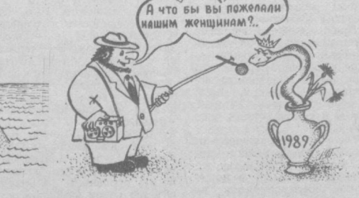
Рис. Ю. ГАЛИМОВА.