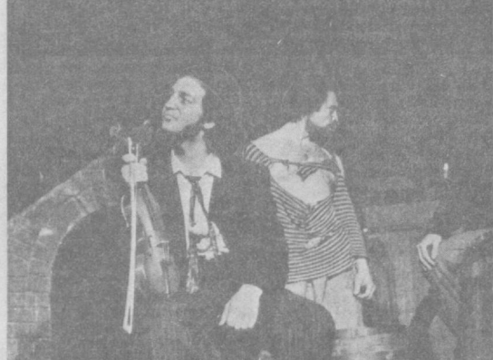
Сцены из спектакля.