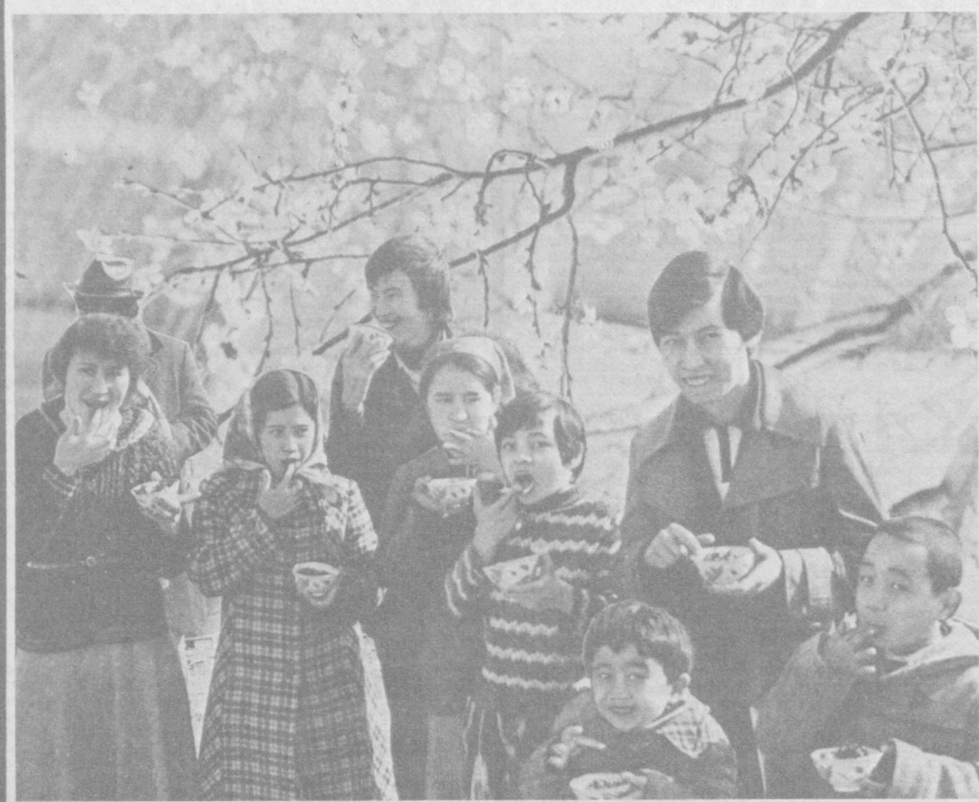
Сладкий, вкусный сумалак.