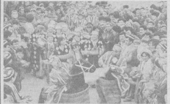
НА СНИМКАХ: праздники весны в Янгйулурганском районе (вверху) приветствуют девушки из Чартаганского медицинского училища; (внизу) — массовое гуляние.

И вот в эти мартовские дни в разных концах нашей земли радостно звучит: Здравствуй, Навруз!