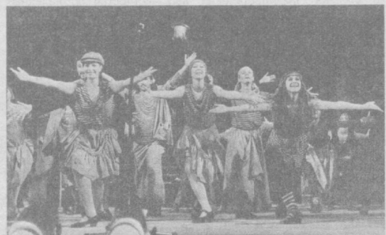
Сцены из спектакля.