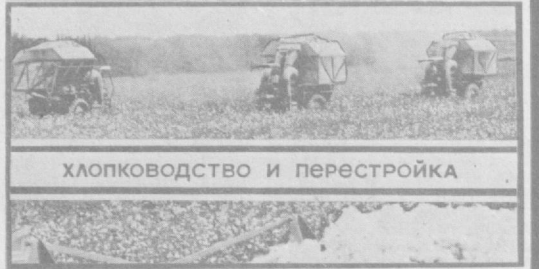
Хлопководство и перестройка

Создание надежной, высокоэффективной хлопкоуборочной машины не снимается с повестки дня. Эта и многие другие проблемы механизации хлопководства остаются на контроле «Правды Востока». Сегодня мы публикуем очередную подборку материалов.