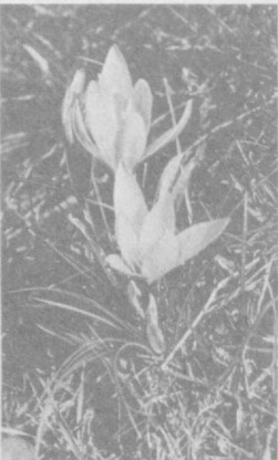
ВЕСНА В ГОРАХ

В. КАРИМОВ. Соб. корр. «Правды Востока», г. Ургут.