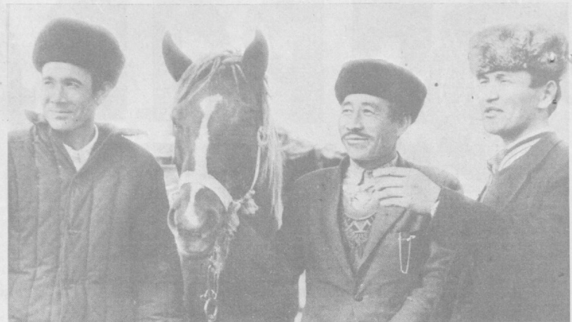
Позади зимовка, можно подвести итог нелегкой работы чабанов в условиях довольно сурового климата здешних мест. Вот он, итог: около девяти тысяч овец и ягнят, крепких, здоровых, которых уже вывели на весеннее пастбище. На ферме № 1 совхоза «Кызыл-Кала» Берунийского района, постав-