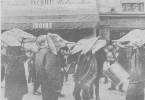
Правительства африканских стран, обеспокоенные варварским истреблением «властиново саванна» предприняли меры для ограничения охоты на них. 95 государств уже подписали КИТЕС — конвенцию о международной торговле редкими видами живой природы. В соответствии с этим документом запрещен ввоз бивней в обход официальной квоты, установленной для каждого африканского государства. На каждом законно импортируемом бивне соответствующее африканское государство ставит свой несмываемый номерной номер, который, как и вес, хранится в памяти ЭВМ в Швейцарии. В случае необходимости можно взвесить любой бивень и свериться с данными компьютера. Эта мера дисциплинирует даже не самых усердных таможенников.

Впервые отметил этот феномен еще испанский священник Хуанеро Серра, основавший собор в 1776 году. С тех пор 19 марта — день святого Джозефа — отмечается жителями Сан-Хуан-Капистрано как праздник прихода весны. По поверью, ласточки каждый год опускаются в этот день на крышу «Доумд эдоуб», чтобы почтить память святого. Однако, как свидетельствуют ученые, птица привлекает прохладные нити в стенах собора, как нельзя лучше подходящие для вывода потомства. И все же постоянство ласточек, неизменно завершающих перелет длиной в 8 тысяч километров с мест зимовки в Аргентине на родину именно 19 марта, — факт, несомненно, удивительный.