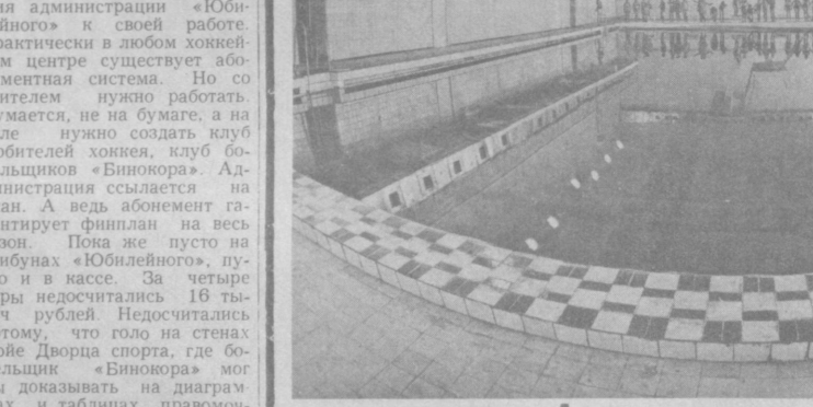
Новый крытый плавательный бассейн вступил в строй в городе строителей Тумуэусио.

За счет каких резервов можно выиграть у сильного? За счет дружбы, взаимовыручки, когда играют, не оглядываясь по сторонам, а так, что товарищ поддержит.