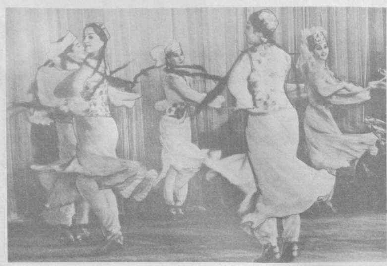
лауреата Государственной премии СССР Кахрамона Дадаева; в вихре танца — девушки.