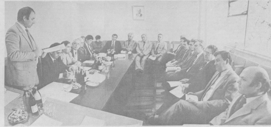
НА СНИМКЕ: участники встречи.

И если ориентироваться на близкий к нынешнему 1980 год, то в заготовках нет прироста. Тогда к Дню работников сельского хозяйства сняли 80 процентов урожая, сейчас — чуть более 60. Пока что выполнены годовые планы или близки к этому лишь Гурьинский, Ханжирский, Чартакский, Наманганский, Бувайдинский, Ленинградский районы — еще не в каждой области есть такая «первая ласточка». А вот отстающих немало. Особенно тревожное положение в Усман-Юсуповском, Джамбайском, Бахористанском, Мирзачульском, Ильичевском, Хахастском, Зарбдарском, Акалтынском, Баятском, Арнасайском, Кургантинском, многих других районах. Из 500 совхозов и 799