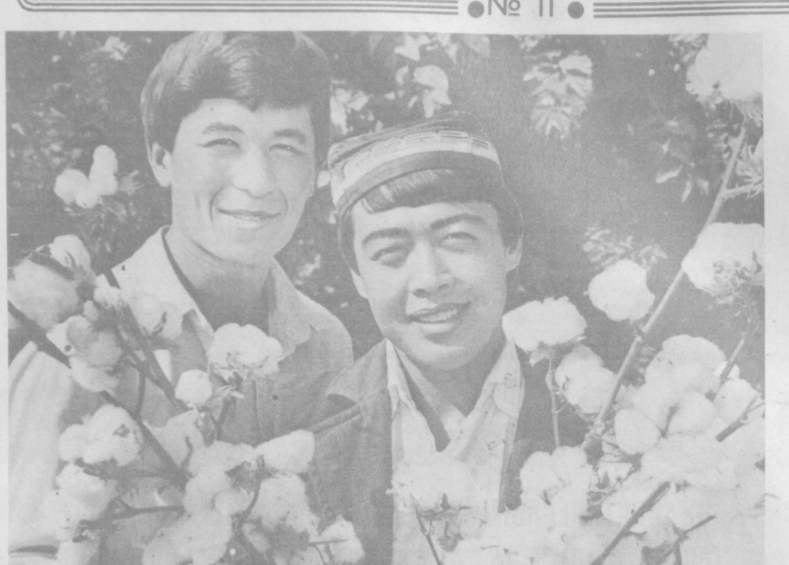
Колхоз имени Ахунбаева Среднеирчского района Ташкентской области — один из крупнейших в области производителей «белого золота». Его труженники нынче обзавелись собирать за сезон по 36 центнеров сырца с гектара. 80 процентов урожая будет убрано машинным. Сейчас на полях работают более 25 уборочных агрегатов.