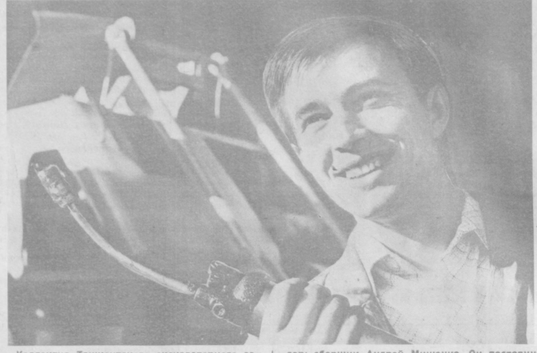
Коллектив Ташкентского экскаваторного завода изготовил в нынешнем году 1.650 экскаваторов. Машиностроители предприятия обязались выполнить годовое задание и 25 декабря.

А. ХАЙРУТДИНОВ. Соб. корр. «Правды Востока», Кегейльский район, Каракалпакская АССР.