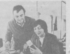
БОЛГАРИЯ. Серийный выпуск электронного телефонного аппарата «ТА-1300» освоил коллектив завода «Телефон-устройствостроения» в городе Велозградина Видинского округа. Новая модель инновационного аппарата обладает рядом преимуществ, в том числе оперативной памятью. И концы нынешнего года предположительно освоит производство еще 26 новых видов телефонных аппаратов. Около 80 процентов продукции предприятия экспортируется в СССР и другие страны — члены СЭВ.

Перед лицом эскалации американской агрессии министерство обороны Никарагуа издало указ о создании резервных батальонов на базе закона «О патриотической воинской службе». Под действие этого закона подлежат мужское население в возрасте от 24 до 40 лет. Военную подготовку резервисты будут проходить по месту работы или учебы.