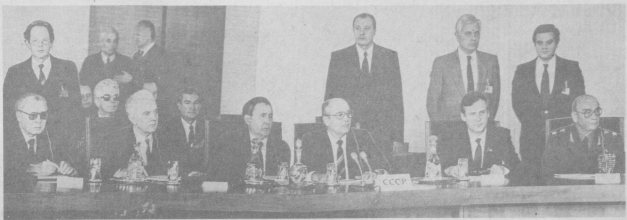
Советская делегация в зале совещания.

СОФИЯ, 22 октября (ТАСС). В столице Народной Республики Болгарии сегодня начало работу очередное совещание Политического консультативного комитета государств — участников Варшавского Договора. В совещании принимают участие: от Народной Республики Болгарии — Т. Живков — Генеральный секретарь ЦК Болгарской коммунистической партии, Председатель Государственного совета Народной Республики Болгарии, глава делегации; Г. Филипов — член Политбюро ЦК БКП, Председатель Совета Министров НРБ; П. Младенов — член Политбюро ЦК БКП, министр иностранных дел НРБ; Д. Джурев — член Политбюро ЦК БКП, министр национальной обороны НРБ; Д. Станишев — секретарь ЦК БКП; от Венгерской Народной Республики — Я. Кадар — Генеральный секретарь Венгерской социалистической рабочей партии, глава делегации; Д. Лазар — член Политбюро ЦК ВСРП, Председатель Совета Министров ВНР; М. Сюреш — секретарь ЦК ВСРП; П. Варко — член ЦК ВСРП, министр иностранных дел ВНР; И. Олах — член ЦК ВСРП, министр обороны ВНР; от Германской Демократической Республики — Э. Хонеккер — Генеральный секретарь ЦК Социалистической единой партии Германии, Председатель Государственного совета Германской Демократической Республики, глава делегации; В. Штоф — член Политбюро ЦК СЕПГ, Председатель Совета Министров ГДР; Г. Ансен — член Политбюро, секретарь ЦК СЕПГ; Г. Гофман — член Политбюро ЦК СЕПГ, министр национальной обороны ГДР;