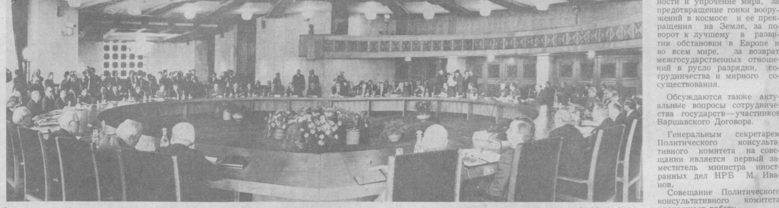
В зале совещания.

РКП, Президентом СРР Н. Чаушеску; Чехословацкой Социалистической Республики — во главе с Генеральным секретарем ЦК КПЧ, Президентом ЧССР Г. Гусаком. Делегации встречали Т. Живков, Г. Филипов, другие руководящие партийные и государственные деятели НРБ.