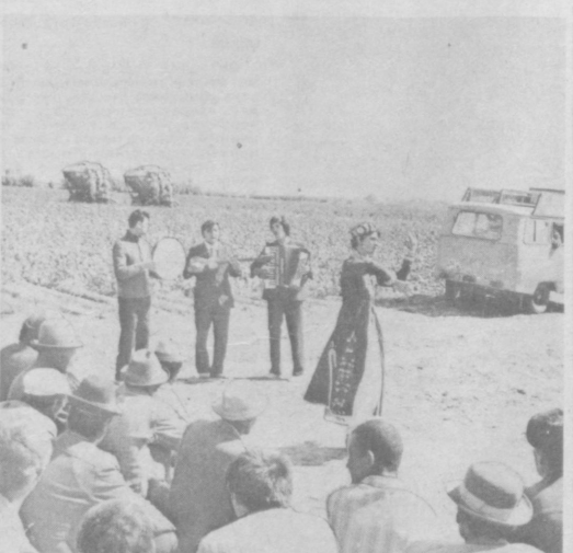
Земледельцы колхоза имени Карла Маркса Ходжейлинского района КПСРР обильно получают в нынешнем году по 27 центнеров хлопка с каждого гектара, что на три больше запланированного. Основную часть урожая намечено собрать с помощью техники.