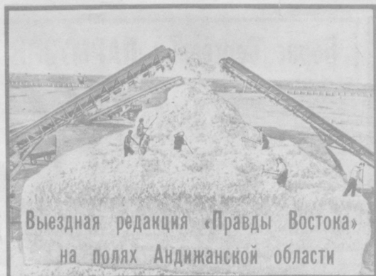
Выездная редакция «Правды Востока» на полях Андижанской области