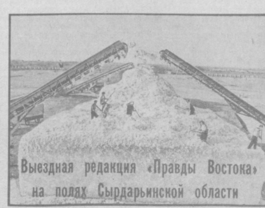
Выездная редакция «Правды Востока» на полях Сырдарьинской области

● АНДИЖАНСКАЯ ОБЛАСТЬ Земледельцы Комсомолабадского района рапортовали о выполнении социального обязательства за завершающего года пятилетки — государству продано более 35 тысяч тонн «белого золота».