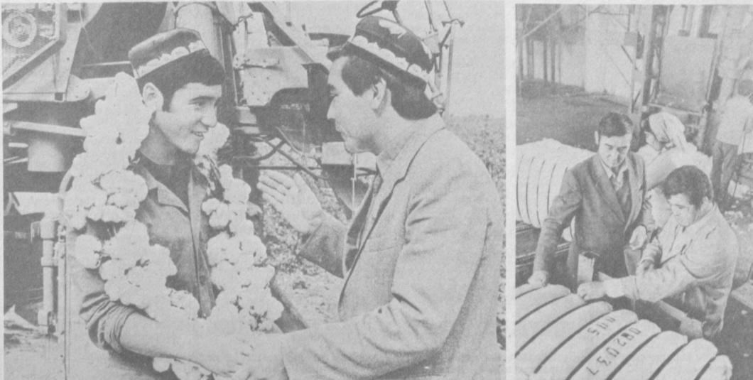
Земледельцы колхоза «Коммунизм» Алтынкульского района нынче взяли высокие обязательства — дать Родине «белого золота» на тысячу тонн больше запланированного, а всего произведи 6.200 тонн. Все силы направлены на то, чтобы и 68-й годовщине Великого Октября рапортовать о валтии намеченного рубежа.

СПКБ Всесоюзного объединения «Союзнефтеавтоматика». Всего тридцать восемь секунд — и информация, поступающая с пятнадцати буровых, — на экране дисплея. Она говорит специалистам о глубине забоя, давлении промывочной жидкости, весе бурового инструмента и многом другом. Автоматизация сбора, передачи и обработки необходимых данных позволяет повысить оперативность и контроль за процессом бурения. Подсчитано, что экономический эффект от внедрения только одной системы «Пирс» составит 274 тысячи рублей в год. Ее серийный выпуск обеспечит Андижанский опытный завод Всесоюзного объединения «Союзнефтеавтоматика». За разработку «Пирса» ведущие конструкторы удостоены бронзовых медалей ВДНХ СССР. (УзТАГ).