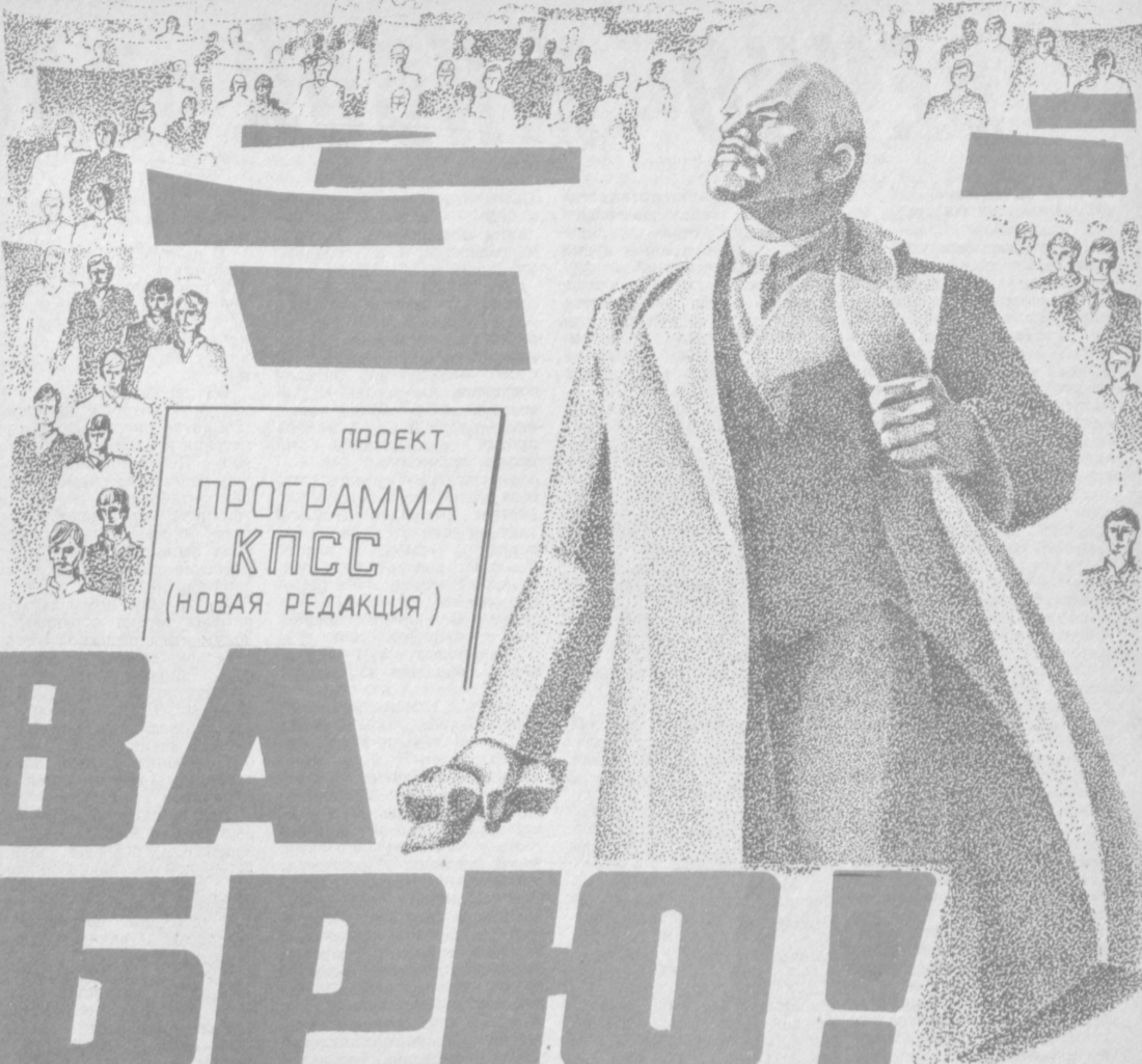
Плакат В. МУРОМЦЕВА.