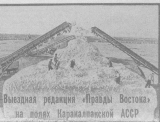
Выездная редакция «Правды Востока» на полях Каракалпакской АССР