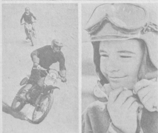
ФОТОРЕПОРТАЖ НА ТРАССЕ — МОТОЦИКЛИСТЫ

Большой популярностью среди жителей Хаманского района Ташкента пользуется мотоспорт. Любителей умелой езды на мотоциклах всех возрастов объединяет районный спортивно-технический клуб ДОСААФ. Искусному вождению мотоцикла обучают здесь опытные тренеры. Они привлекают членов клуба любовью к технике, развивают у них такие качества, как мужество, ловкость. Мотогонщики этого клуба в течение ряда лет занимают лидирующее положение не только в городе, но и в республике, завоеывая на соревнованиях призовые места.