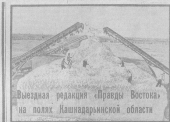
Выездная редакция «Правды Востока» на полях Кашкадарьинской области

Поднять всю партийную работу на уровень новых задач, внести максимальный вклад в выполнение программы ускорения социально-экономического развития страны, решительно бороться со всем, что мешает на этом пути, — об этом говорили все выступавшие на конференции. Отмечалось, что за отчетный период трудовые коллективы района добились определенных успехов. На основе модернизации и реконструкции промышленных предприятий увеличили выпуск продукции, расширили ее ассортимент, повысили качество изделий. Возросла ответственность научных учреждений и высших учебных заведений, исследовательских и проектных институтов, конструкторских бюро за подготовку высококвалифицированных кадров, за создание новых машин и