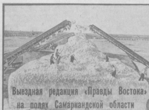
Выездная редакция «Правды Востока» на полях Самаркандской области