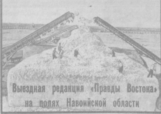
Выездная редакция «Правды Востока» на полях Навоийской области

Труженники хозяйства ежедневно сдают на кирман более 12 тонн хлопка.