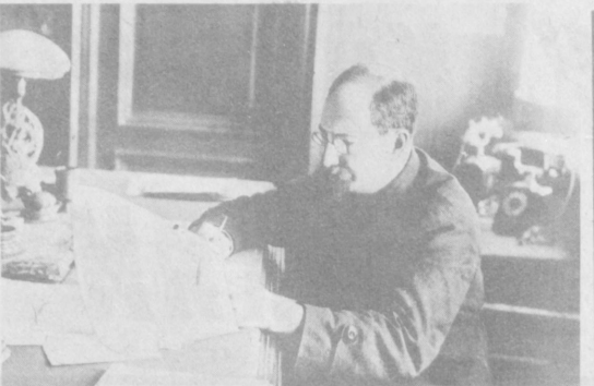
Анатолий Васильевич Луначарский в своем рабочем кабинете (1922 год).

учных учреждений, театра, кино, издательского дела, развитие советской литературы, изобразительного искусства, музыки. Луначарский много сделал для сплочения старой интеллигенции вокруг Советской власти и Коммунистической партии, создания новой интеллигенции из среды рабочих и крестьян. Он стал одним из пламенных проводников ленинских идей культурной революции. Не щадя своих сил, боролся Луначарский за лучшее будущее советских людей. Интерес к творческому наследию Луначарского не ослабевает, многие его идеи, высказывания остаются актуальными и в наши дни.