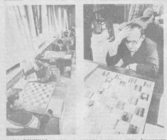
НА СНИМКАХ: сверху — играют чемпионы мира Александр Кандауров (Москва) и Г. Дорфман (Ташкент); слева — в зале Республиканского шахматно-шашечного клуба; справа — трехкратный чемпион СССР, гроссмейстер Арнадий Плахнин.