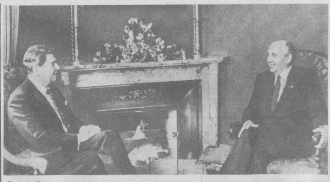
Во время беседы.

Поддерживая почин 18-ти передовых труженников республики, строители и медиаторы решили достойно встретить XXVII съезд КПСС.