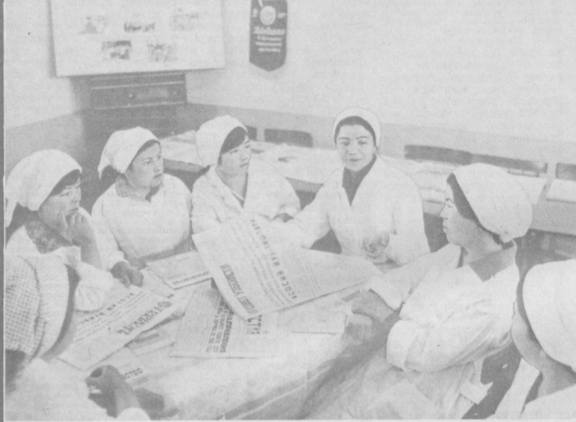
Труженики колхоза «Коммунист» Ордоникидзевского района Ташкентской области, как и все трудящиеся республики, принимают активное участие в обсуждении предвыборных документов партии.